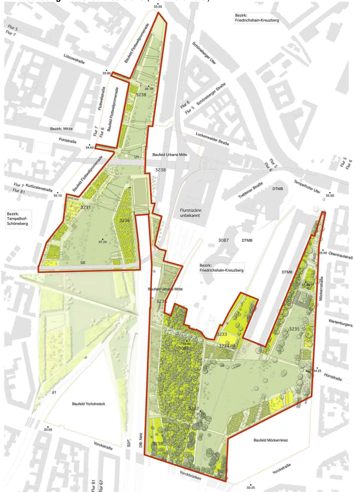
Abbildung 1: Freiraumbereiche (Plan Büro Loidl)

eine langsame Verbindung auf. An den Eingängen wird die schnelle Asphaltverbindung stets durch einen Plattenbelag unterbrochen, um die Aufmerksamkeit der Rad- und Skatefahrer zu erhöhen. Durch die Verbindung der Kammern entsteht ein Netz an Wegeverbindungen.