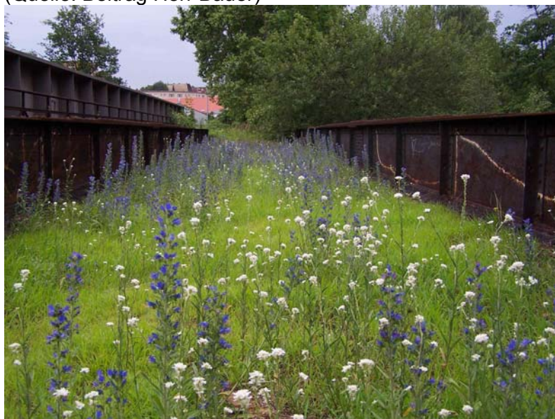
Abbildung 2: Yorckbrücken, stahlgefasste Beete

Herr Bauer spricht das Problem der Trampelpfade an, das durch die Rechtwinkligkeit der Wege entstehen wird. Angesichts der nicht möglichen Realisierung des Generalzuges, als eine den Park überspannende und verbindende Brücke, fragt er nach dem vorhandenen Budget. Er verlangt einen Kassensturz und fordert die Vorstellung der Testplanung für eine Brücke. Das Kammerensystem der Parkränder hält er für zu kleinteilig um Wege, verschiedene Nutzungen und historische Spuren unterzubringen. Er befürchtet, dass zu wenig Bestand in dieser Planung erhalten bleibt und die historischen Spuren verschwinden werden. Er spricht vom „Grünen Teppich“ und einer „Kahlschlagsanierung“. Außerdem gibt Herr Bauer zu bedenken, dass die möglichen 300.000 zukünftigen Nutzer des Parks heterogen in Ihren Nutzungsansprüchen sind, und deshalb die geplante große Wiese verkleinert werden muss. Bestehende Nutzungen, wie die Galerie der Wildkräuter oder ein Raum für Stadtteilstadt sollten stärker berücksichtigt werden. Darüber hinaus bleibe die Weite des Parks auch bei einer Verkleinerung der Wiesenfläche erhalten. Die Kleingärten im Westpark könnten somit erhalten bleiben. Auch erwartet Herr Bauer einen größeren Flächenbedarf für die unmittelbare Raumeignung durch Bürger. Stahlgefasste Beete gebe es bereits in Form der bewachsenen Yorckbrücken, die er erhalten möchte. Zu wenig Fläche gebe es dagegen für Sport und Spiel.